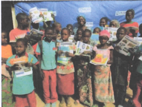
Lehrmaterialien, zur Verbesserung der Schulbildung.