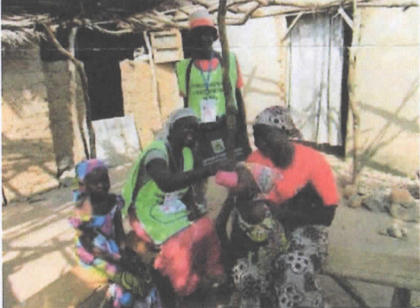
Gesundheitsmitarbeiterin gibt einem Kind ein Malaria-Medikament

Diese Ergebnisse wurden Dank der Bemühungen von Plan International und dem Gesundheitsministerium erzielt. Wir führten mehrere Kampagnen zur Vorbeugung von Malaria durch. Mindestens 232.457 Kinder erhielten Malaria-Medikamente nach diesen Kampagnen.