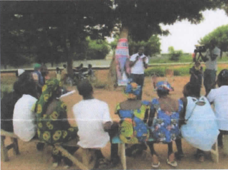
Jugendliche während eines Gesprächs über Sexualerziehung